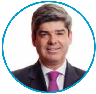
Por Alfonso Aza Jácome, profesor de INALDE Business School.

D urante mis años de universidad, leí un grafiti en un edificio del campus que no pude olvidar: “si luchas puedes ganar, si no luchas ya has perdido”. Cuando tienes un sueño, algo que quieres alcanzar por encima de cualquier otra cosa y, a la vez, es arduo y complejo de conseguir, suelen cobrar fuerza en la imaginación las dificultades que van a surgir en el camino para alcanzar ese sueño.