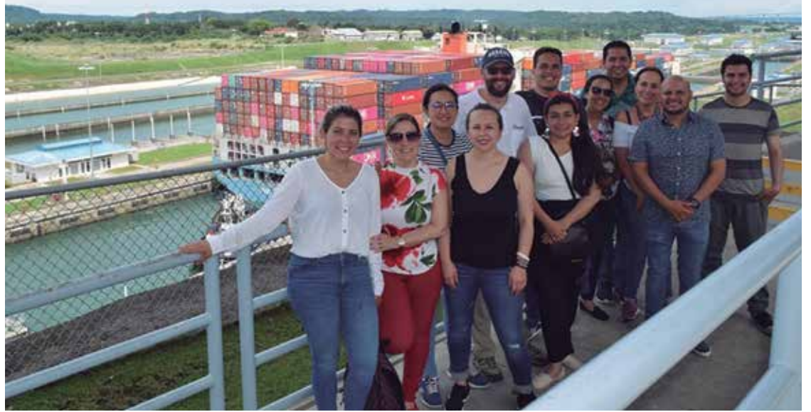
Estudiantes de las especializaciones en Gerencia Logística y Gerencia de Producción y Operaciones, en su visita al Puerto de Panamá.