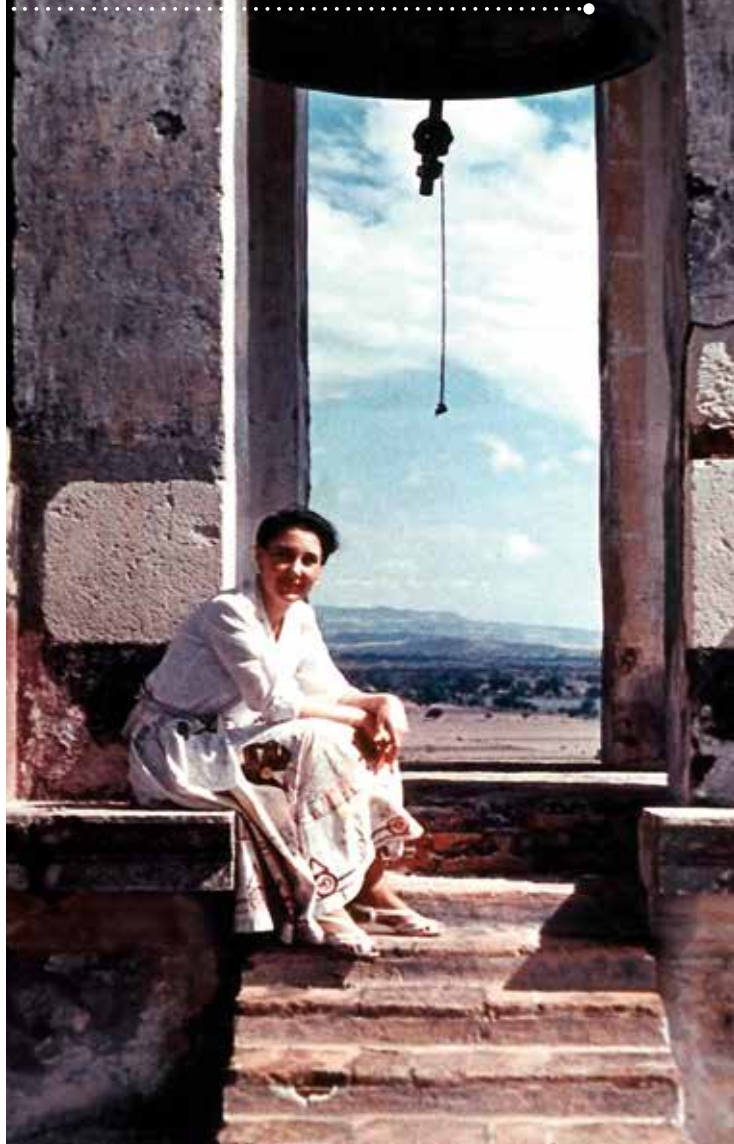
Guadalupe Ortiz De Landázuri ayudó a muchas personas a acercarse a Dios con alegría, servicio y disponibilidad.

Fue una de las 5 mujeres en una clase de 70 estudiantes. Corría el año 1933 y cursaba la carrera de Ciencias Químicas en la Universidad Central de Madrid (España). Fue profesora y llegó a ser catedrática de maestría industrial. Llevó una vida ordinaria, aunque especial para su tiempo.