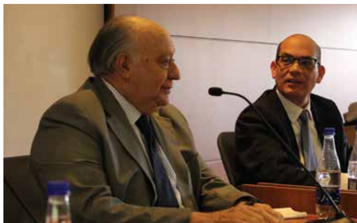
Humberto Calderón Berti, embajador de Venezuela en Colombia, designado por el presidente interino Juan Guaidó.

Ministerio de Relaciones Exteriores. (2019). Venezolanos en Colombia . Recuperado de http://www.migracioncolombia.gov.co/index.php/es/prensa/infografias/infografias-2019/9984-venezolanos-en-colombia