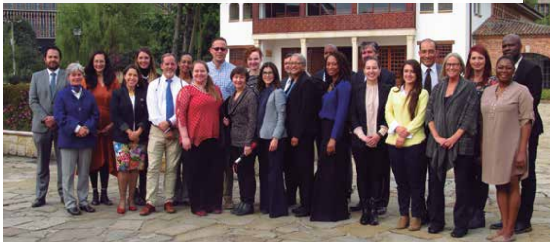
Una delegación de University of South Carolina, con personal de diferentes unidades académicas, entre estas, la Dirección de Relaciones Internacionales, el Departamento de Lenguas y Culturas Extranjeras, la Escuela Internacional de Ciencias Económicas y Administrativas, la Facultad de Medicina y la Facultad de Enfermería y Rehabilitación.

El 12 de marzo, la Universidad de La Sabana recibió la visita de una delegación de University of South Carolina (Estados Unidos), conformada por miembros del personal docente y administrativo de diferentes unidades, quienes conocieron los avances en la infraestructura y algunos aspectos de la estrategia de desarrollo institucional.