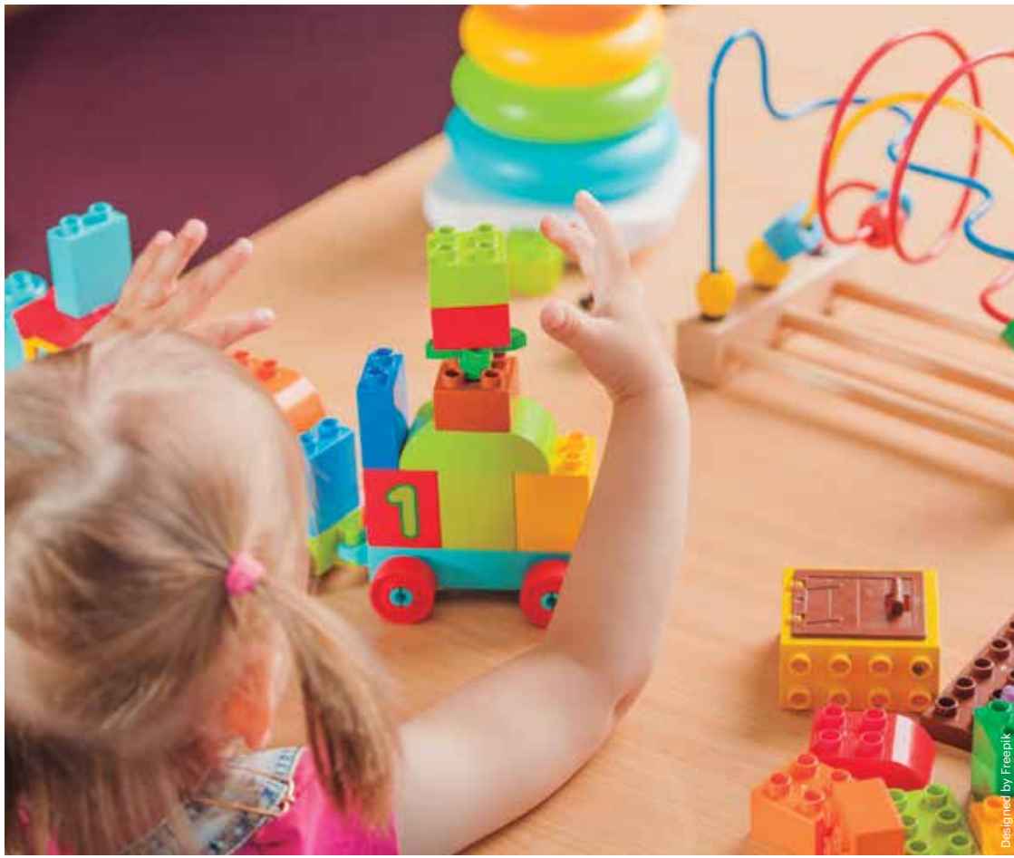
Los recursos educativos y lúdicos deben captar el interés del niño para mantener el esfuerzo y la persistencia.

Al elaborar materiales didácticos es fundamental tener en cuenta la neurociencia y la neuroeducación: la primera estudia el cerebro y el sistema nervioso para entender cómo aprende el ser humano y la segunda integra las ciencias de la educación con las disciplinas que se ocupan del desarrollo cognitivo.