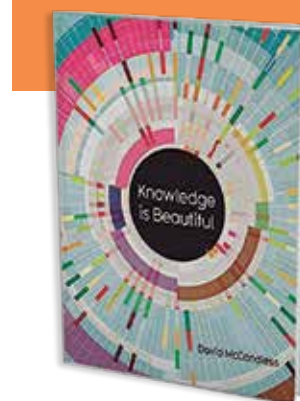
Tabla de contenido: https://bit.ly/2FgEiCD