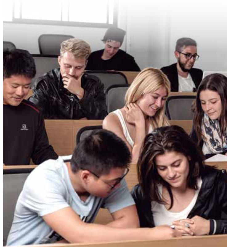
El papel de los educadores es crucial para llevar a cabo una formación crítica que permita abordar nuevas temáticas desde diferentes puntos de vista.