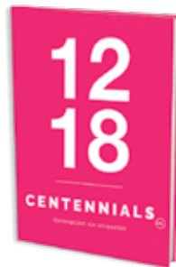
Tabla de contenido: http://bit.ly/2FgDdeP .