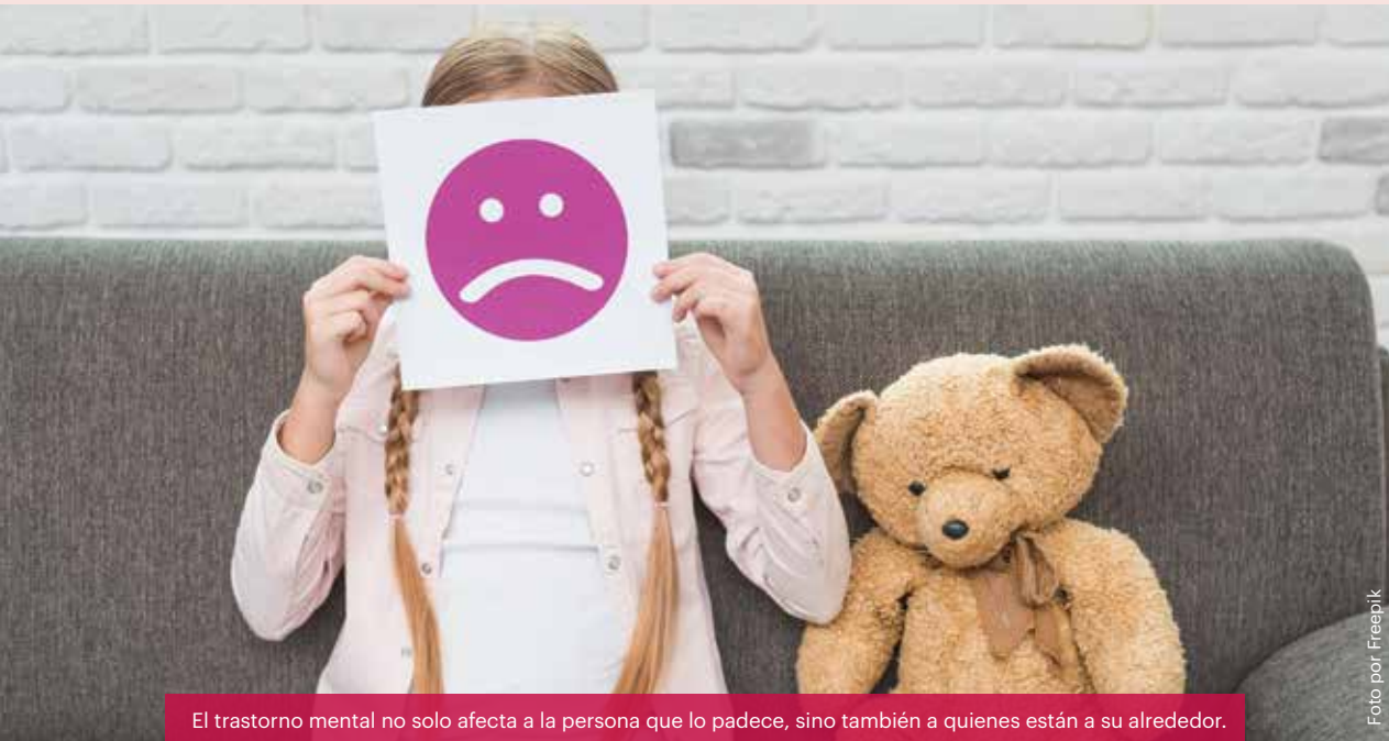
El trastorno mental no solo afecta a la persona que lo padece, sino también a quienes están a su alrededor.