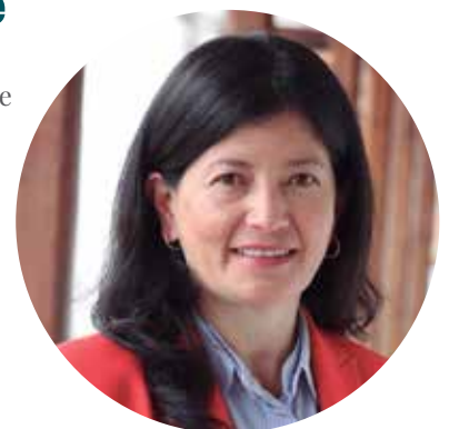
Profesora Departamento de Lenguas y Culturas Extranjeras 15 años de servicios prestados

calidades humanas y profesionales que difícilmente pueden encontrarse en otro lugar. Es muy gratificante pertenecer a esta familia y seguir contribuyendo a la transformación y al crecimiento de nuestros estudiantes. 🗣️