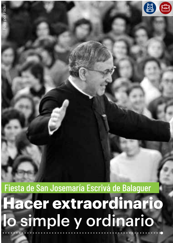
Fiesta de San Josemaría Escrivá de Balaguer