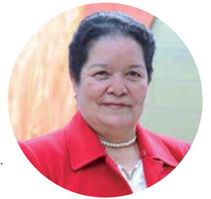
Cajero Alimentos y Bebidas 25 años de servicios prestados

Gracias por esta oportunidad. Nunca debemos olvidar que llevamos el sello Sabana adondequiera que vamos. Ser Sabana, definitivamente, vale la pena. 🗣️