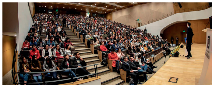
La innovación fue el tema central de tres de las cinco conferencias que hubo en el evento.