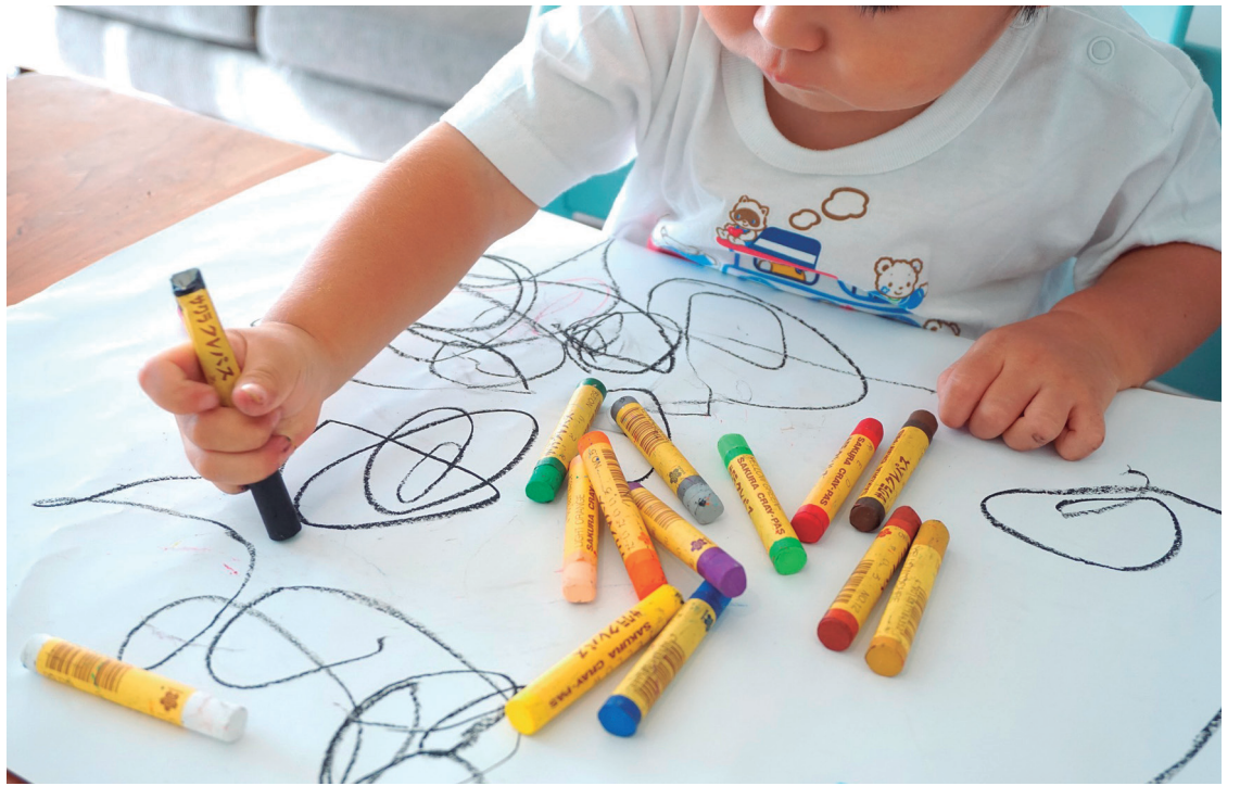
Sentir pasión por ayudar al otro marca una gran diferencia en la labor profesional.

Cuando se estudia una carrera que lleva inmerso un sentido social, las competencias adquiridas deben articularse naturalmente con la vocación de servicio. El hecho de sentir pasión por ayudar al otro marca una gran diferencia en la labor profesional.