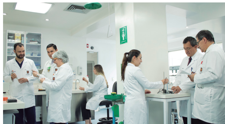
El Grupo de Investigación Evidencia Terapéutica ocupó la posición número 26 en la categoría de Consultorías Científicas y Tecnológicas del ranking de la firma Sapiens Research .

la última convocatoria en salud 2018 por Colciencias, el grupo de investigación realizará uno sobre el desarrollo de un dispositivo para el monitoreo en tiempo real de los tratamientos farmacológicos, en colaboración con la Universidad de Swansea de Gales, Reino Unido, y un grupo de nanotecnología en Barcelona; así como otro proyecto en cooperación con el Instituto Distrital de Ciencia, Biotecnología e Innovación en Salud (IDCBIS), para identificar posibles biomarcadores basados en nanobiosensores, con el fin de mejorar la expansión de células progenitoras hematopoyéticas.