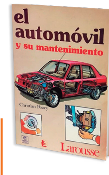
Tabla de contenido: https://bit.ly/2WWFeUI