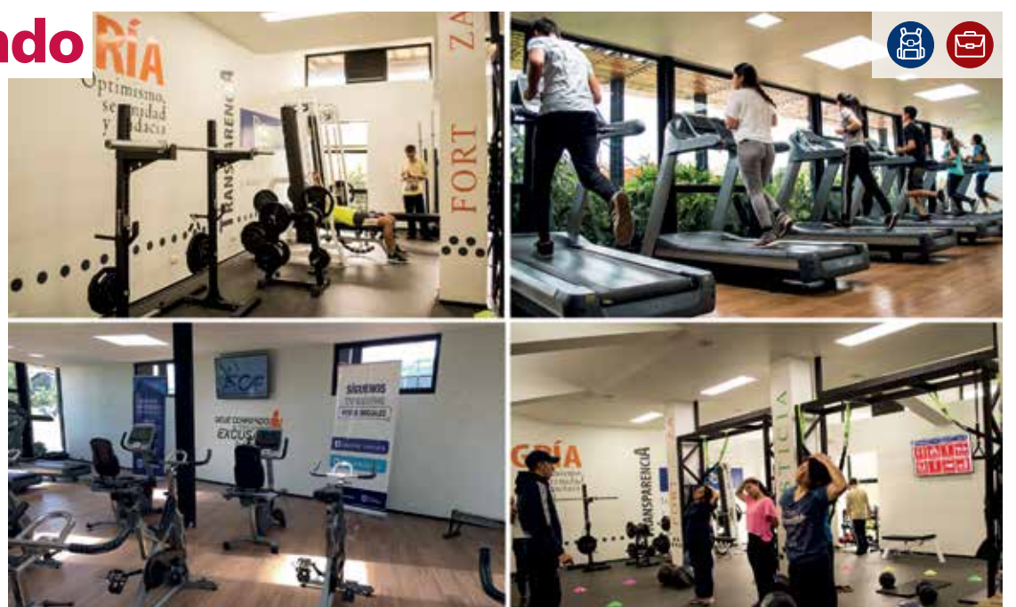
El CAF es un espacio para entrenar adecuadamente con guías profesionales.

Su desarrollo se ha fundamentado en la implementación de un programa innovador, el cual tiene como soporte la ejecución de habilidades básicas, como girar, lanzar, desplazar, saltar y balancear.