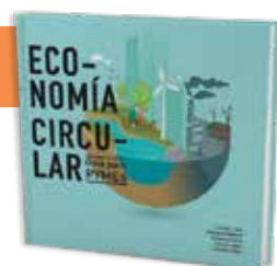
Tabla de contenido: https://bit.ly/2CMBjGe

Autor: Stephen Ferry Ubicación: segundo piso Código: 303.6 F399v