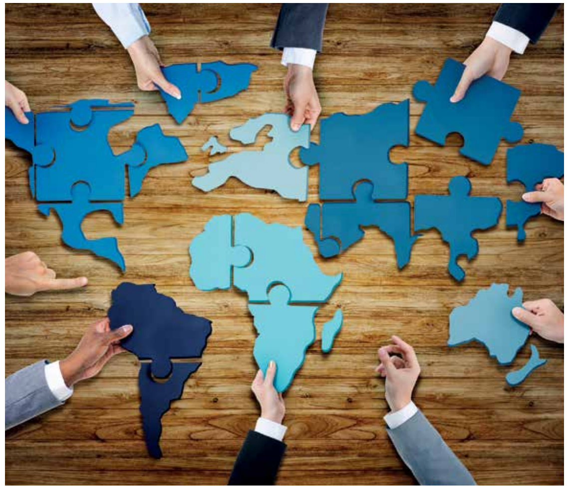
Un organismo internacional es una asociación voluntaria de Estados, creada habitualmente a través de un tratado.

Para hablar de crisis basta con mirar al lado. Según los reportes de prensa de los últimos meses, Venezuela aún no sale de su grave situación, a pesar de que tiene el apoyo de gran parte de la comunidad internacional, que ha desconocido el régimen de Nicolás Maduro y ha dado su respaldo al presidente interino Juan Guaidó. Varios organismos internacionales han alzado la voz frente a esta complicada realidad, pero hay posiciones encontradas frente a la efectividad de estas asociaciones. Para explicar este escenario, se deben responder dos preguntas: ¿qué es un organismo internacional?, ¿hasta qué punto es eficaz al ejercer presión?