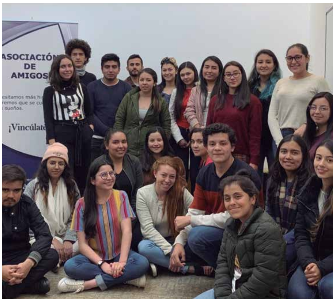
El 28 de marzo se llevó a cabo el encuentro semestral entre la Fundación Cavalier Lozano y sus estudiantes. La Dirección Central de Estudiantes les dio una charla sobre las características de un buen líder.

La familia Cavalier Lozano, creadora de Alquería, ayuda a cumplir los sueños de muchos estudiantes de Cundinamarca. Con su fundación, busca contribuir a la equidad para forjar el camino hacia la paz.